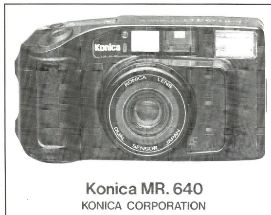
Konica MR. 640 KONICA CORPORATION

3 sekunder. Den elektroniske lukker eksponerer fra 1/5 til 1/500 sekund. Fokuseringen sker ved infrarød. Der er her tale om et letbetjeneligt familiekamera, der kan anvendes i al slags vejr, og som tåler en skylning under hanen. Der er tillige indbygget UV-filter. Formatet er 24×36 mm. Prisen bliver kr. 2.295,00.